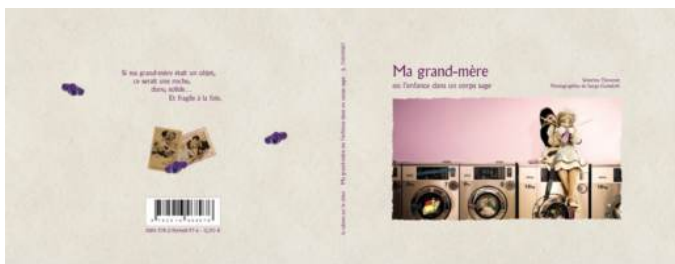
“Ma grand mère ou l'enfance dans son corps sage”