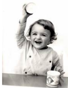
“Historique de la fromagerie Montrachet” ...avant LA FABRIQUE.